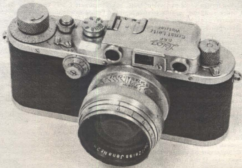
Leica IIIb с объективом Carl Zeiss Sonnar 50/1,5

Снимая Зоннаром с близкого расстояния, я часто сталкивался с несовпадением резкости объектива и дальномера, списывая это на свои собственные ошибки. Настоящая же причина несоответствия выяснилась однажды при настройке дальномера фотоаппарата Зоркий-4. Для регулировки был использован метод съемки косо расположенной миры. Одновременно с настройкой мне еще захотелось проверить реальную глубину резкости для